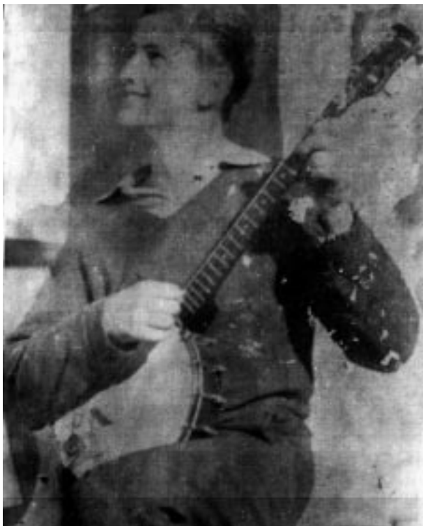
1961. Moje pravé americké tenorbendžo. Můžete třikrát hádat, jaký že akord to právě hraji? Velmi dobře! Takto se vsutku hraje C dur.