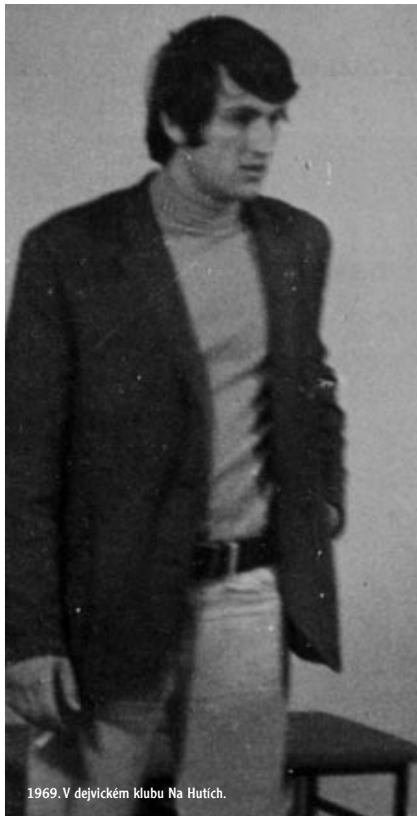
1969. V dejvickém klubu Na Hutích.