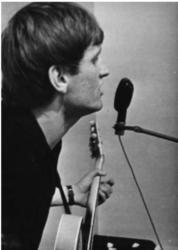
1965. Na Ořechovce s oranžovou kytarou v ruce.